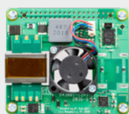
Raspberry Pi 3 B+ PoE HAT 产品编号: 365188006