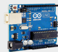
Arduino Uno R3 评估板 产品编号: 207538206