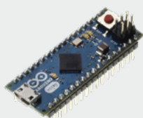
Arduino Micro 开发板 产品编号: 228519406