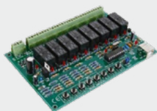
继电器卡套件 产品编号: 280426206