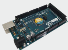
Arduino Mega 2560 开发板 产品编号: 221277906

AM3358 ARM Cortex-A8 MCU, 4GB eMMC板载闪存, USB接口