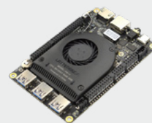
嵌入式单板计算机 产品编号: 351785406